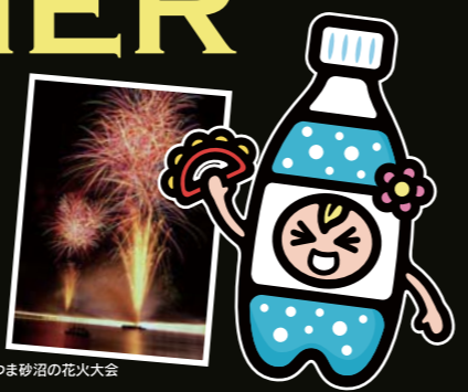
しもつま砂沼の花火大会

今年の夏もお祭りや花火大会など、県内ではたくさんのイベントが開催されます♪そんな中からCouta編集部がオススメのお祭情報をピックアップ!もちろん夏の風物詩・花火大会情報も網羅♪チェックして、今年の夏を思いっきり楽しんじゃいましょう!!