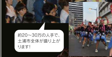
約20~30万の手で、土浦市全体が盛り上がりです!

日本2位を誇る広大な湖・霞ヶ浦まで巻き込み、土浦市が「おまつりムード」に包まれます。目抜き通りを中心に、七夕おどりの披露や、土浦市民による山車が勇壮と街を練り歩きます。霞ヶ浦の土浦港では遊覧船のホワイトアイリス号や観光帆船の操業、水辺体験イベントなどが開催。霞ヶ浦の自然を満喫できるイベントが盛りだくさんです!その他の場所でも、カレーの街・土浦ならではの「真夏のカレーフェア」などが催されます!